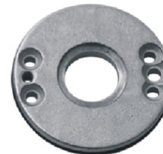
liga de zinco zinc alloy aleaccion de zinco